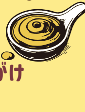
-C チーズがけ Cheese ¥200