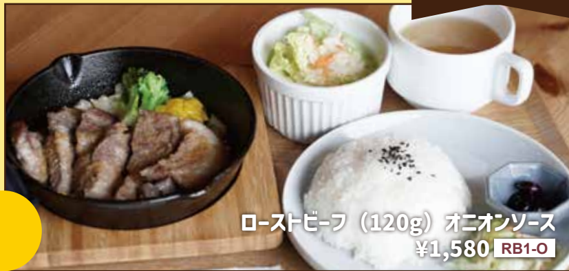
ローストビーフ (120g) オニオンソース ¥1,580 RB1-O