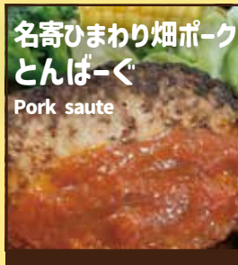
名寄ひまわり畑ポーク とんぱーぐ Pork saute