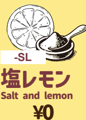
-SL 塩レモン Salt and lemon ¥0