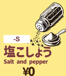
-S 塩こしょう Salt and pepper ¥0