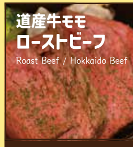
道産牛モモ ローストビーフ Roast Beef / Hokkaido Beef