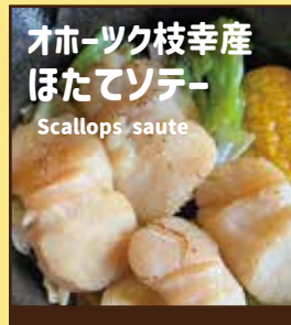
オホーツク枝幸産 ほたてソテー Scallops saute