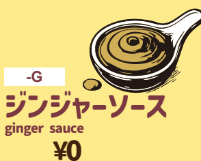
-G ジンジャーソース ginger sauce ¥0