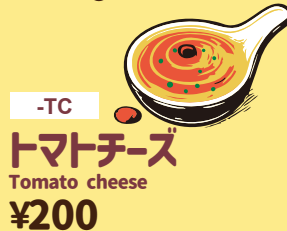
-TC トマトチーズ Tomato cheese ¥200