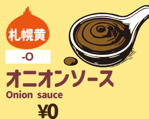
札幌黄 -O オニオンソース Onion sauce ¥0