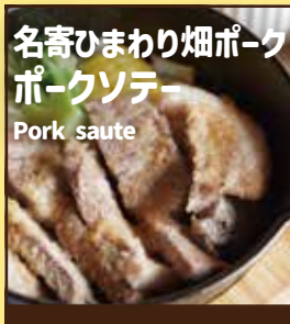
名寄ひまわり畑ポーク ポークソテー Pork saute