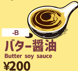
-B バター醤油 Butter soy sauce ¥200