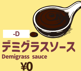
-D デミグラスソース Demiglass sauce ¥0