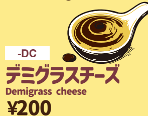
-DC デミグラスチーズ Demiglass cheese ¥200