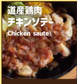
道産鶏肉 チキンソテー Chicken saute